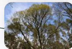
Gudower Mühle, Schleswig-Holstein